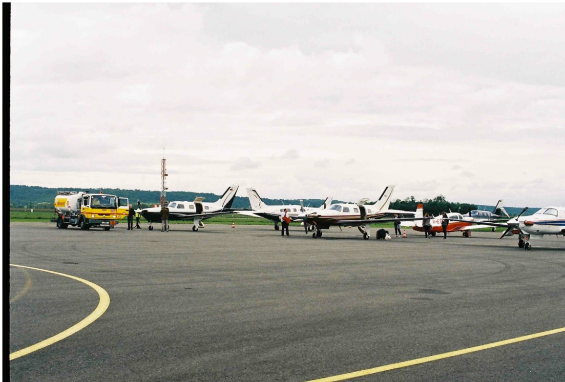
Step by step kamen alle gut an und genossen nach der Ankunft im Design-Hotel Rex