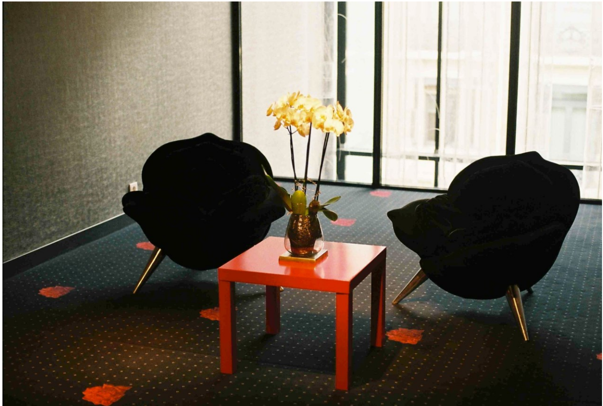
das Welcome im Restaurant UNIK.