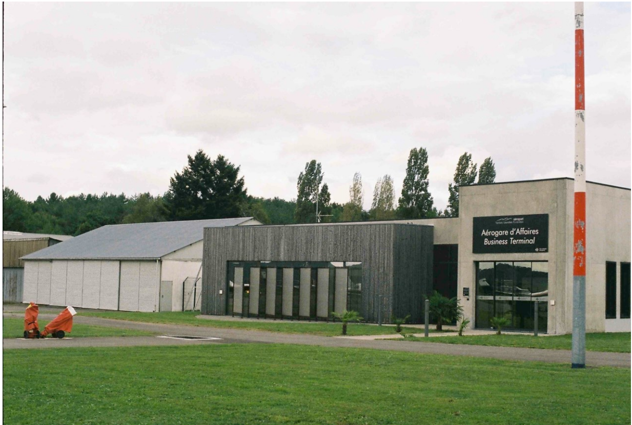
der Mitarbeiter des Business Terminals Tarbes Lourdes Pyrénées.