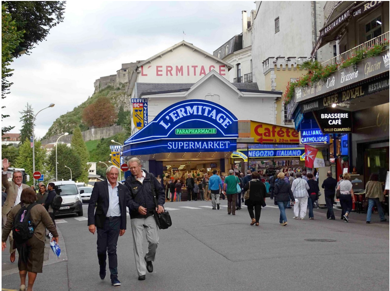
Wir fahren nach Lourdes, aber nicht nur um ein sehr gutes Abendessen im Restaurant Alexandra zu genießen.