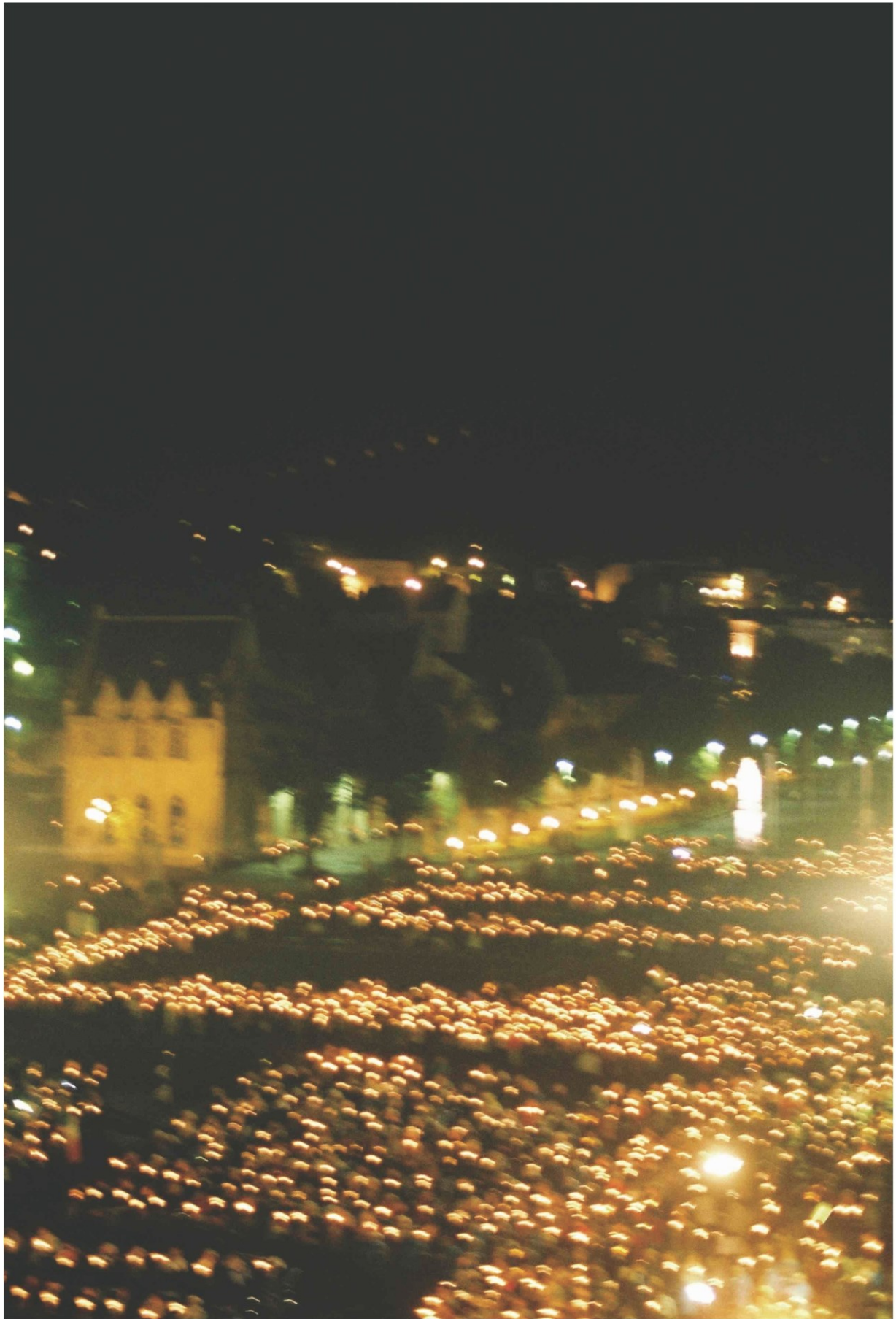
Bewegende Momente bei den Gläubigen in der Hoffnung auf Marias Segen.